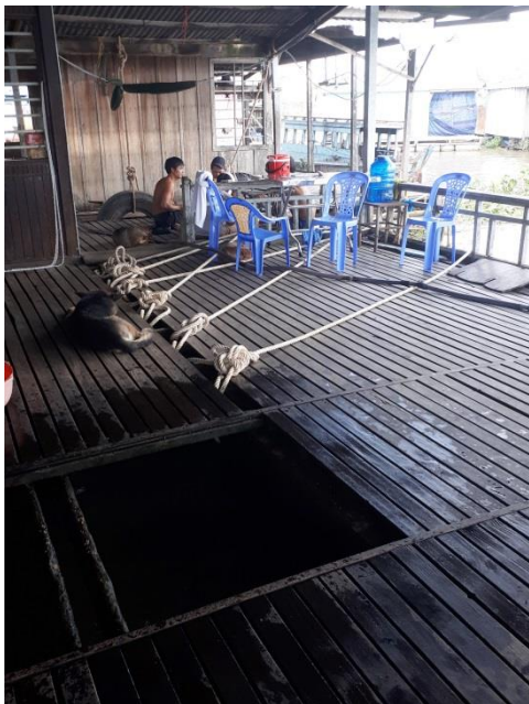
Visteelt in een drijvend huis.